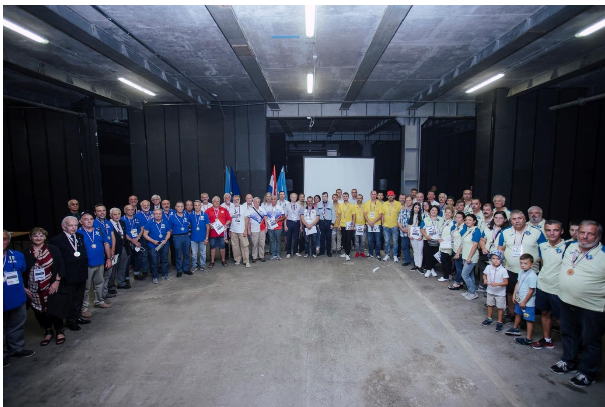
Závěrečná fotografie všech účastníků